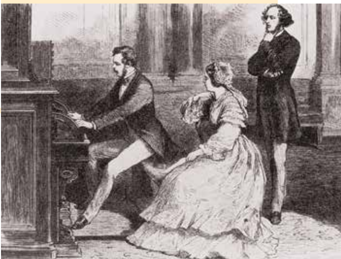
Felix Mendelssohn im Buckingham Palace bei der jungen Königin Viktoria und Prinzgemahl Albert.

In den wohlhabenden Kreisen des Bürgertums des 18. und 19. Jahrhunderts gehörte es zum guten Ton, die Söhne – und in aller Regel nur sie – an der Schwelle zum Erwachsenenalter auf eine Bildungsreise durch Europa zu schicken. Sie sollten ihre Bildung möglichst noch