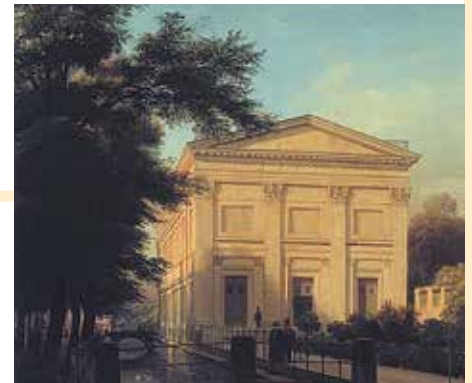
Die Singakademie in Berlin, Ölgemälde von Eduard Gärtner, 1843. Mit der Wiederaufführung der seit ihrer Uraufführung 1729 praktisch nicht mehr gespielten »Matthäuspassion« von Johann Sebastian Bach begründete Mendelssohn hier im März 1829 die Renaissance von Bachs Musik und der Musik des Barock, die damals nicht mehr als zeitgemäss gegolten hatte. Mendelssohn war Persönlichkeit genug, um das Können anderer zu achten. Für ihn war es, wie er einmal schrieb, »die erste Bedingung zu einem Künstler [...], dass er Respekt vor dem Grossen habe und sich davor beuge und es anerkenne und nicht die grosse Flamme auszustupfen versuche, damit das kleine Talglicht ein wenig heller leuchte«. Entsprechend hat er sich sein Leben lang für das Schaffen anderer Musiker eingesetzt und viele unbekannte und sonst vielleicht unwiederbringlich verloren gegangene Werke der Vergessenheit entrissen.